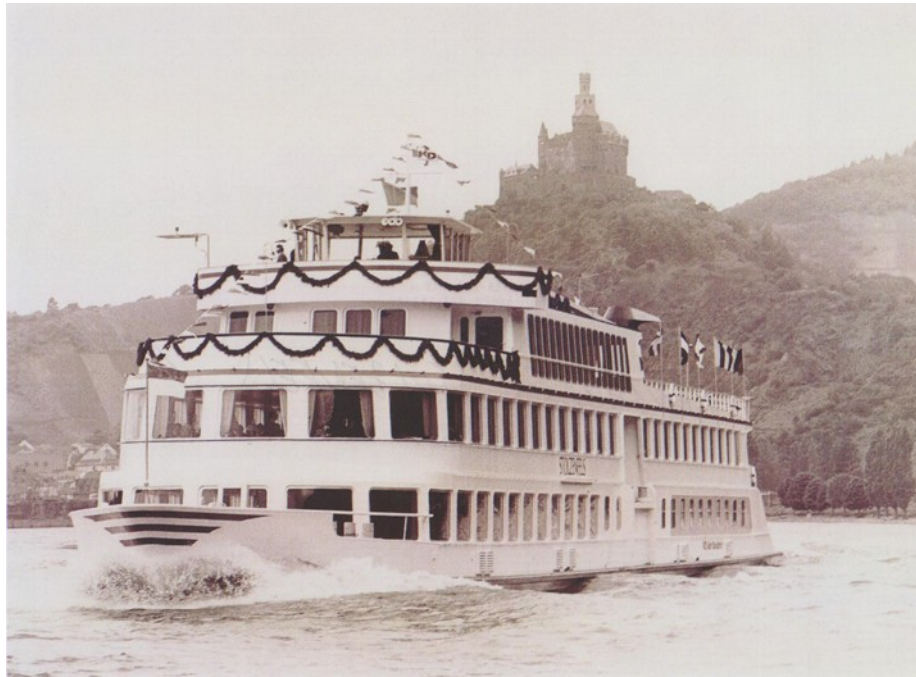
Jungfernfahrt der „Stolzenfels“ im Jahr 1979