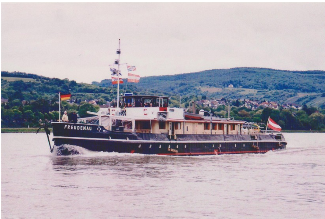
FREUDENAU – Schiffahrtsmuseum Regensburg (Ex-Donauschlepper) am Rheinufer in Braubach