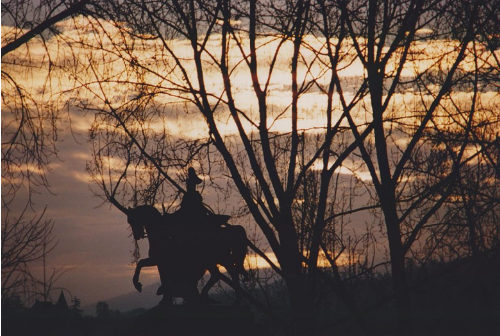
„Deutsches Eck“ in der Morgensonne