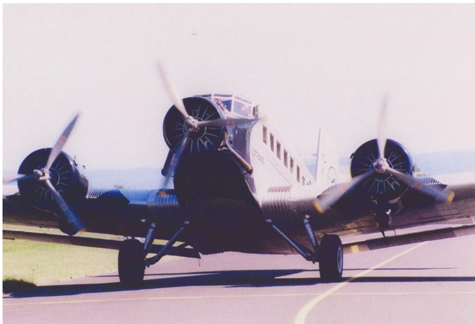
JU – 52 in Winnigen