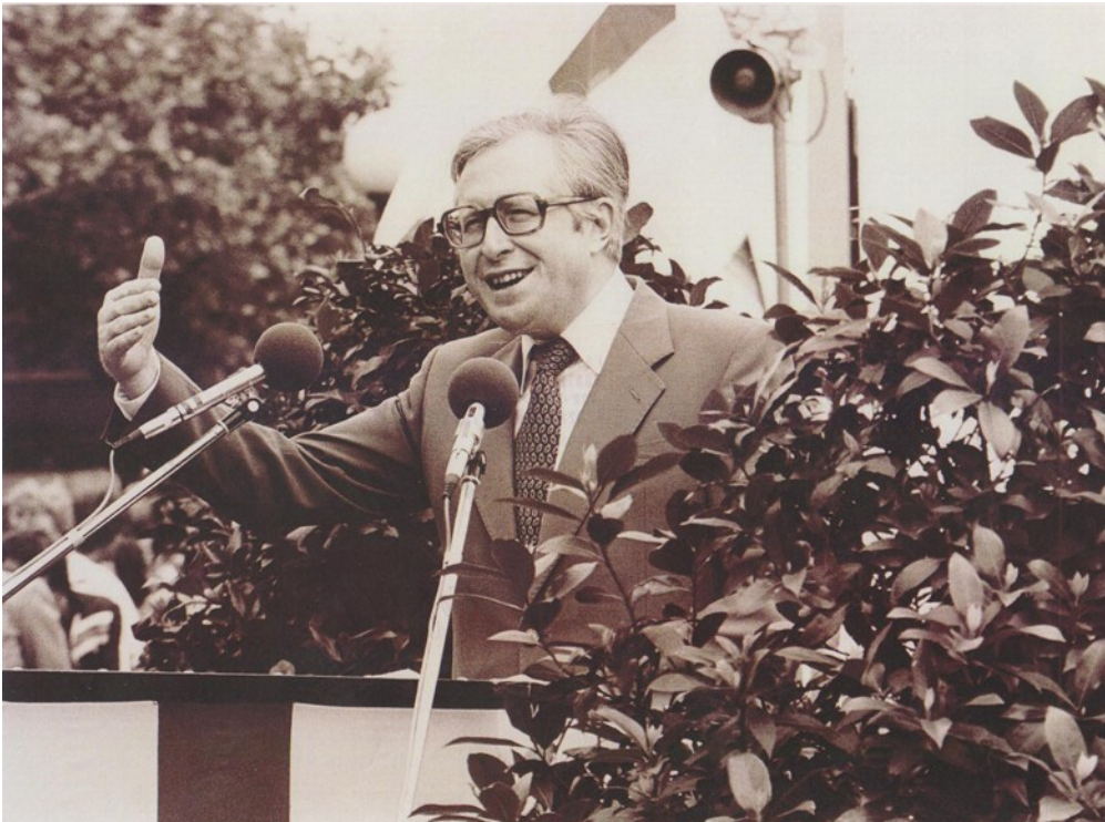
Ministerpräsident Bernhard Vogel im Jahr 1979 in Koblenz