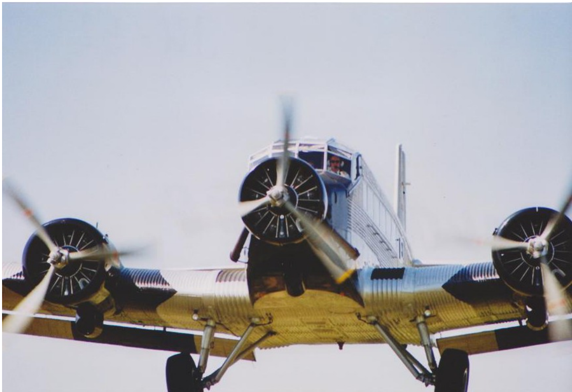
Landeanflug der JU – 52 in Winnigen