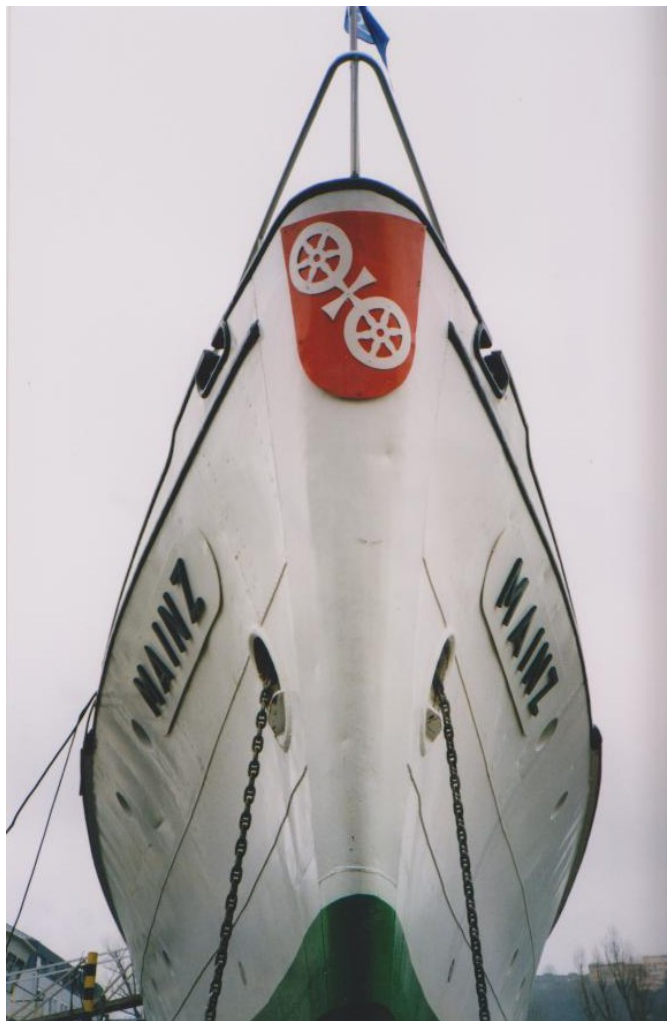
Bereisungsschiff der WSV auf Helling, WSA Koblenz