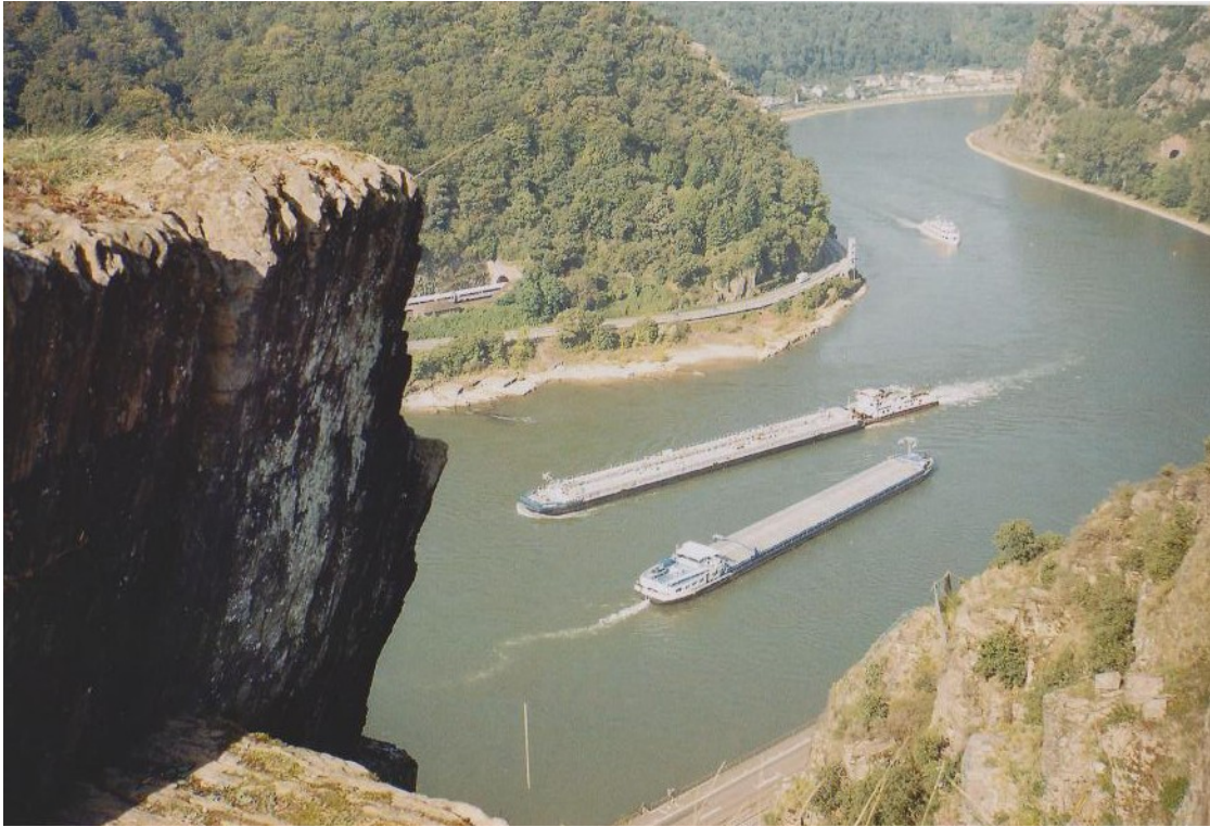
Blick vom Spitznack in Richtung Loreley