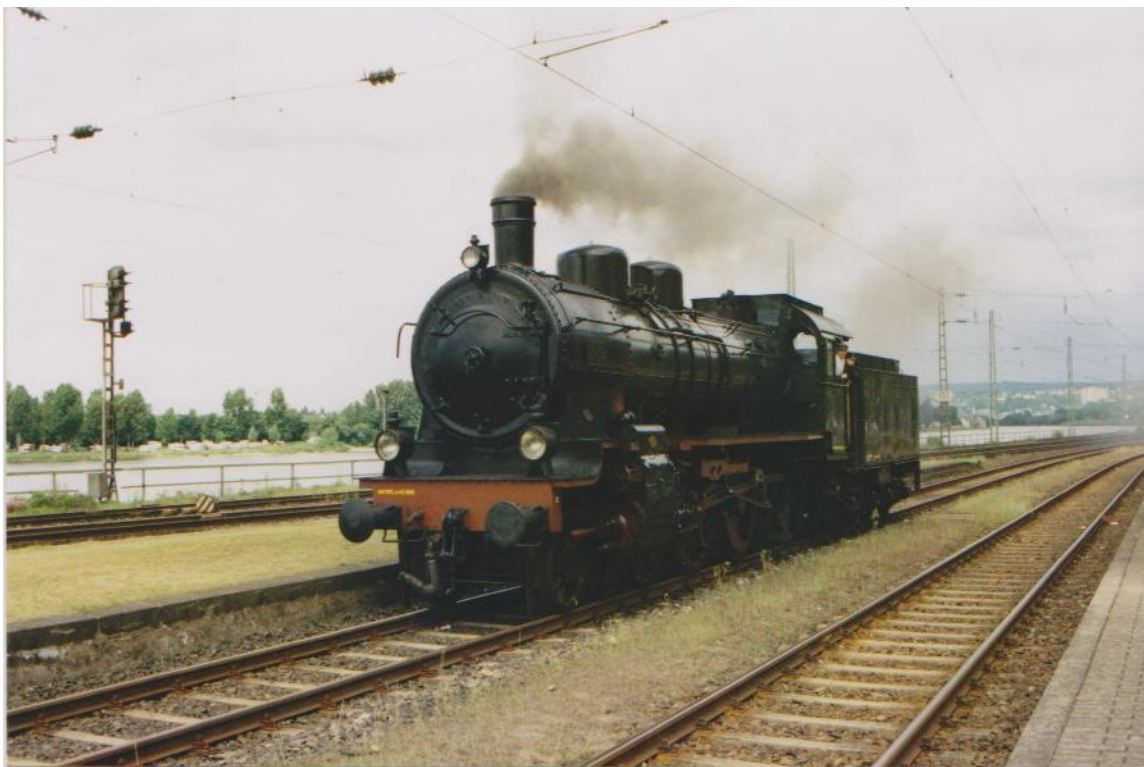
Koblenz – Ehrenbreitstein