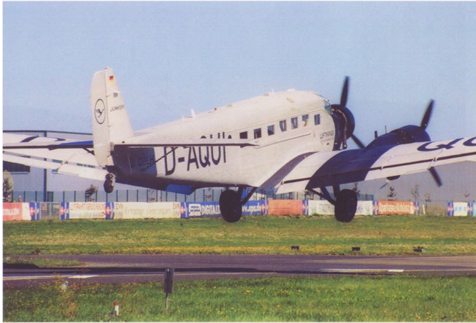
Landung der JU – 52 in Winnigen