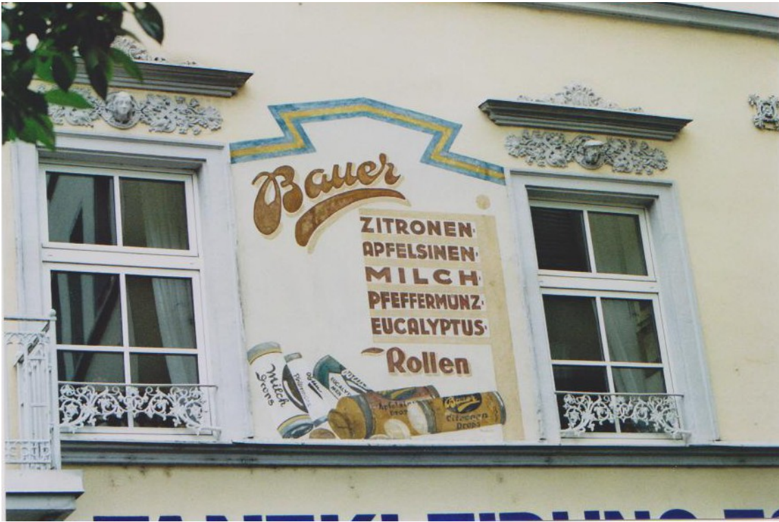
In der Altstadt von Koblenz