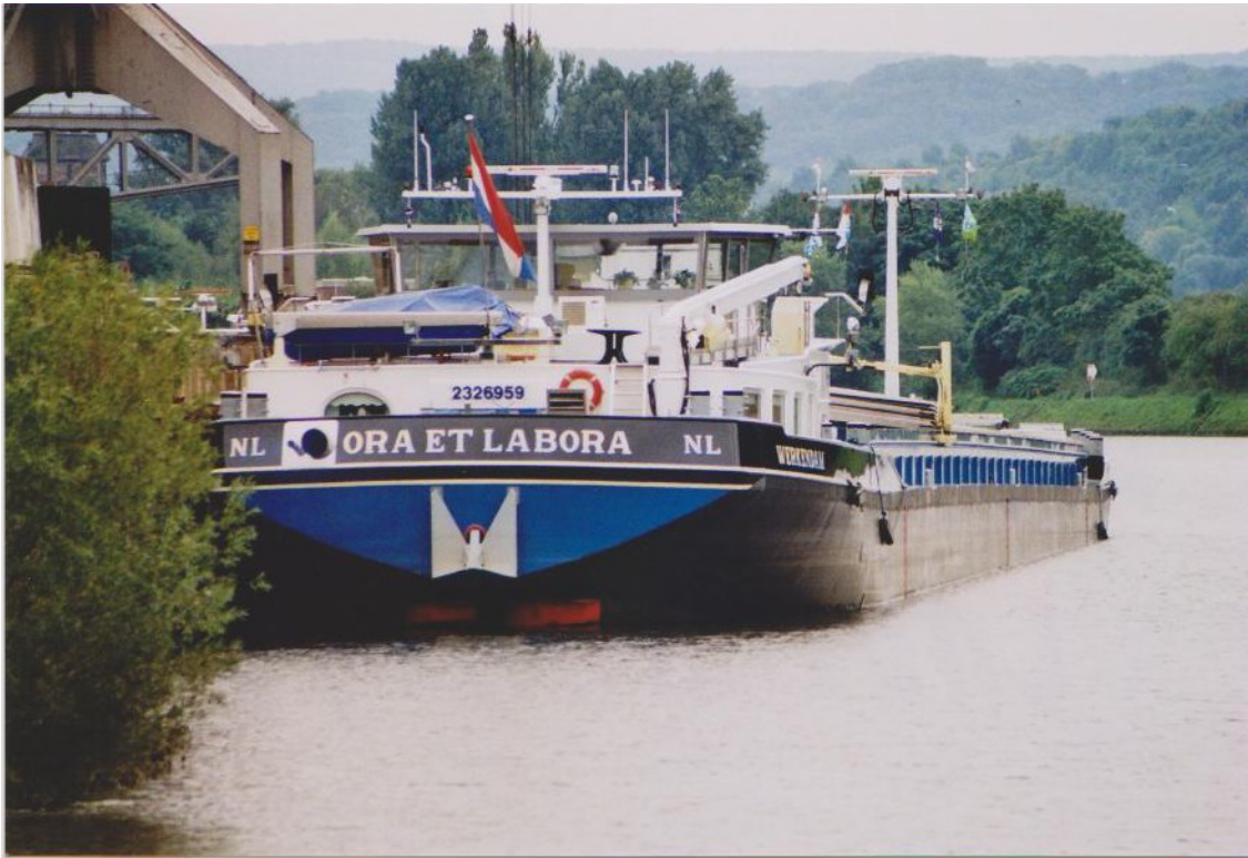
Hafen in Lahnstein am Rhein