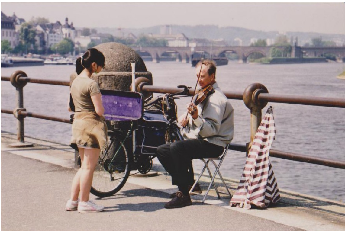
Am „Deutschen Eck“ in Koblenz