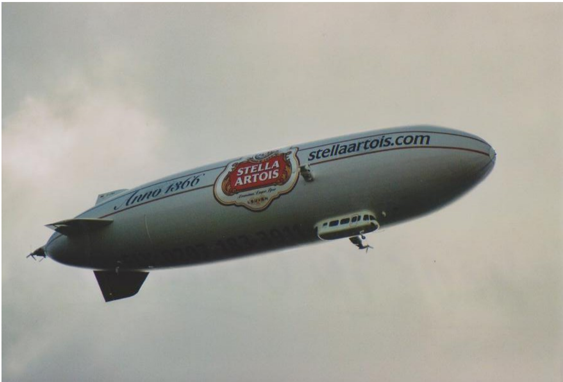
Made in Germany